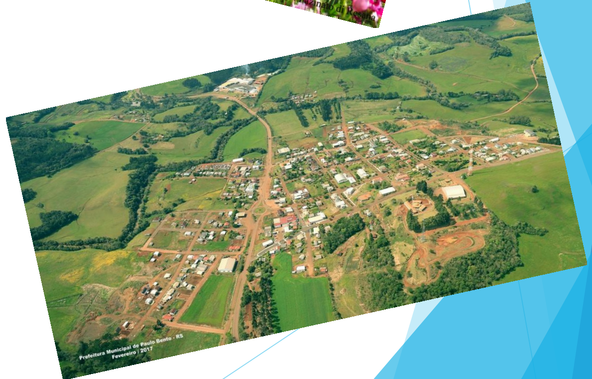
Prefeitura Municipal de Paulo Bento - RS Fevereiro | 2017