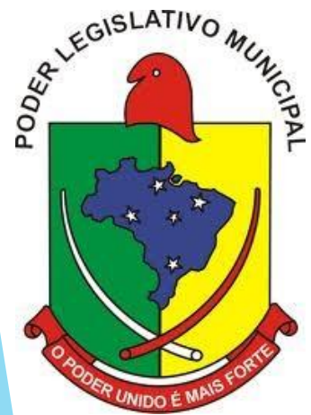
Prefeitura Municipal de Paulo Bento - RS Fevereiro | 2017